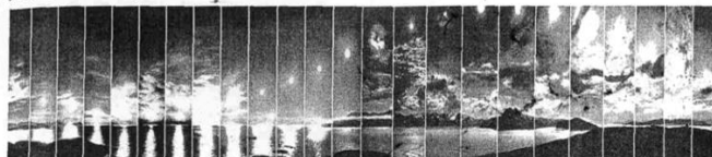
Langzeitphoto der Mitternachtssonne in Norwegen

Solche Vorgänge lassen sich durch Graphen modellieren, mit denen wesentliche Eigenschaften erfasst und erläutert werden können. Viele der periodischen Vorgänge können durch trigonometrische Funktionen modelliert werden, häufig lässt sich dabei auch die passende Funktionsgleichung finden.