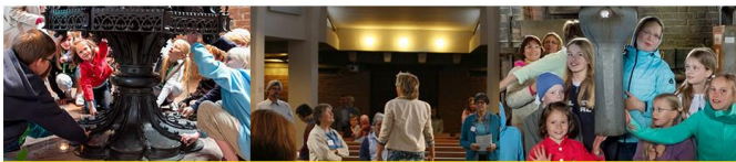
Start - Kirchenpädagogik - Grundannahmen und Ziele der Kirchenpädagogik