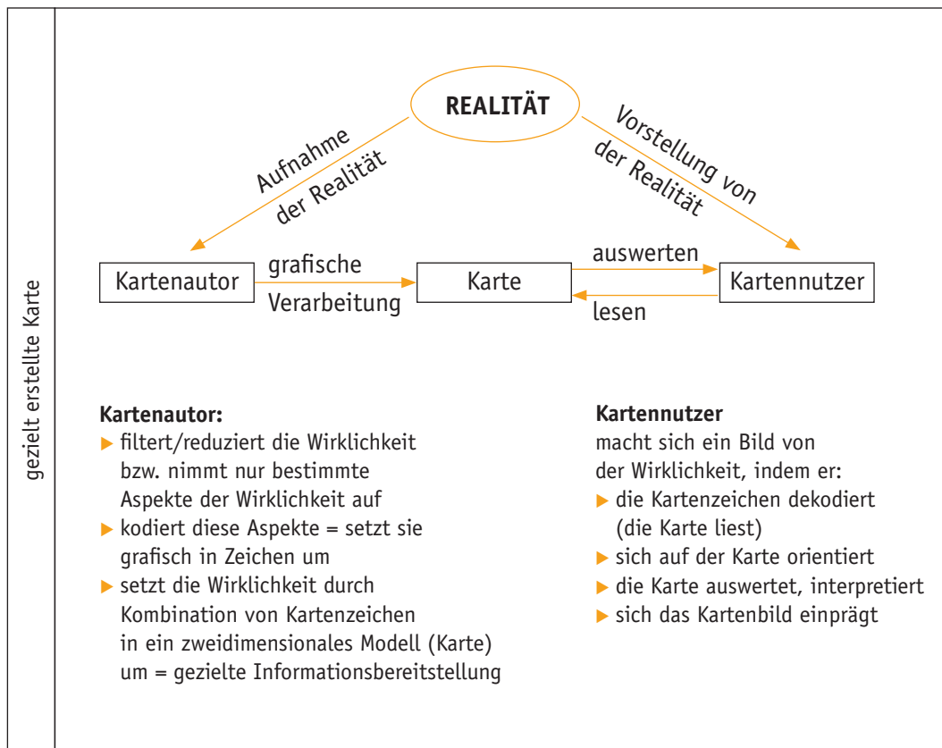
Abb. 3 Realität und Karte