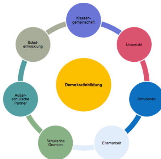
Abbildung 2: Ebenen der Demokratiebildung im schulischen Umfeld (2)

Partizipation kann dabei auf verschiedenen Ebenen innerhalb des Schullebens stattfinden: